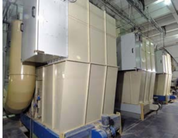
Enfriadores verticales a contracorriente