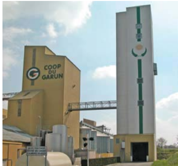
Torre de tratamiento térmico aislada para limitar riesgos de contaminación