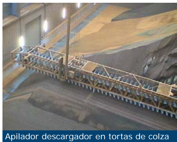
Apilador descargador en tortas de colza