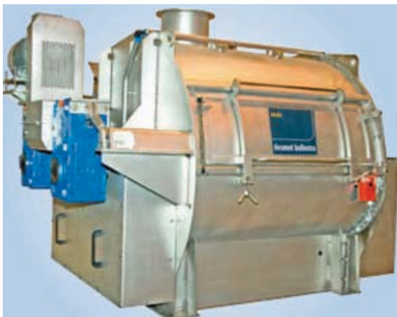
Mezcladora de palas con ejes sincronizados