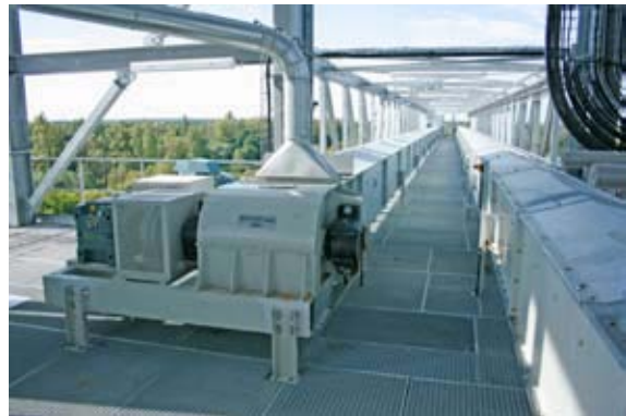
Transportador de cadena

Para aplicaciones fuera de esta gama, nuestro Departamento Técnico tiene las competencias para desarrollar transportadores específicos que responderán a sus necesidades.