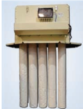
Filtro de mangas para transporte neumático

Desde el filtro de bolsas pequeño para vacia-sacos hasta el filtro de mangas grande para una limpia centralizada, STOLZ le propone una solución óptima para responder a sus necesidades de filtración.