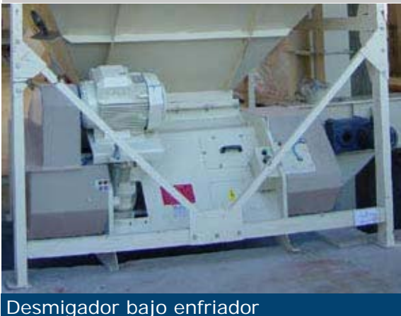
Desmigador bajo enfriador