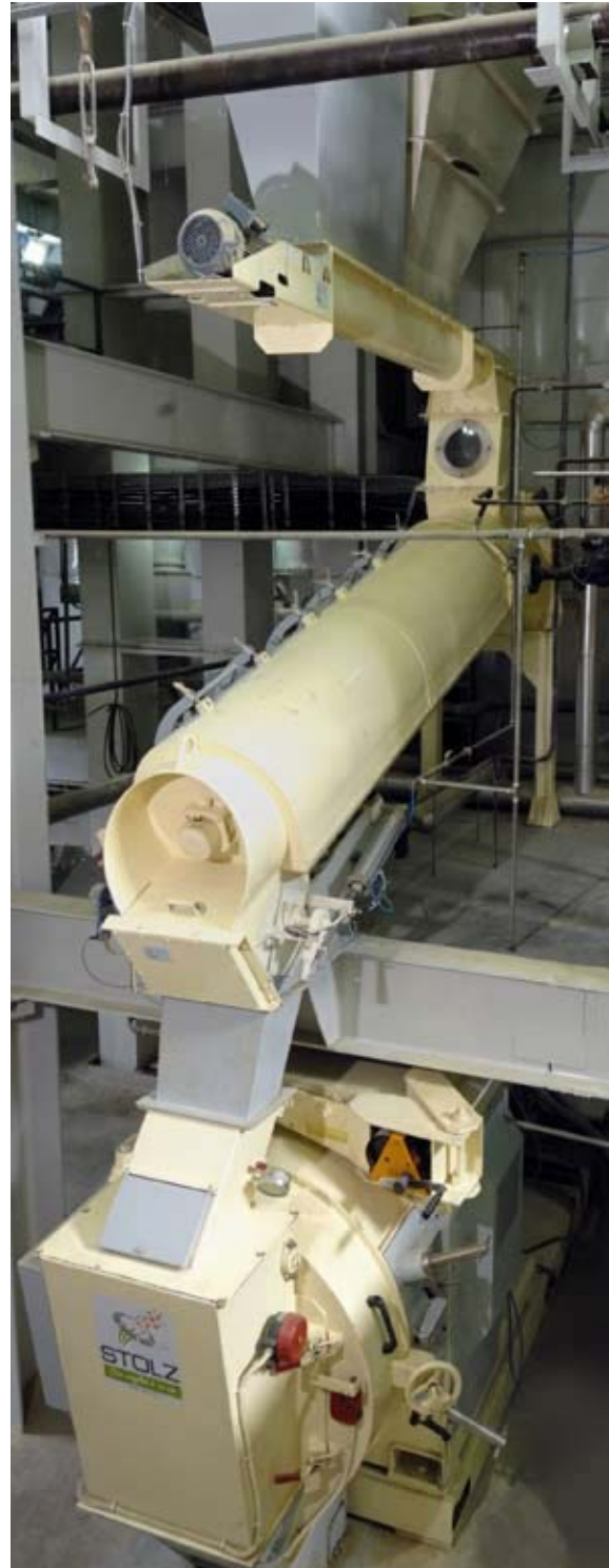
Acondicionador sobre una prensa granuladora

Más detalles en Internet www.stolzsa.com