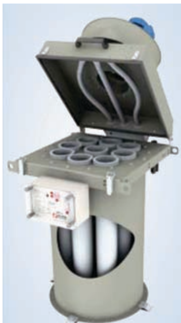
Filtro de mangas para descompresión

Desde el filtro de bolsas pequeño para vacia-sacos hasta el filtro de mangas grande para una limpia centralizada, STOLZ le propone una solución óptima para responder a sus necesidades de filtración.