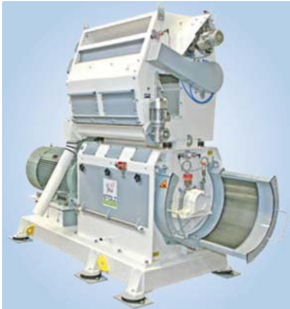
Molino RMP 18 + ABMS 8