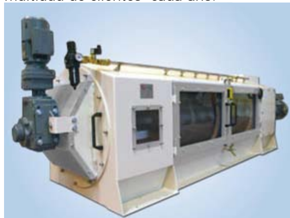
Tamizador centrífugo BCMT 750

Nuestros tamizadores con doble rotación centrífuga y descolmatado en marcha se instalan a la salida de los molinos. Este concepto asociado a la reputación del molino RM y nuestro alimentador - separador magnético - deschinador de la gama alta ABMS es atractivo para multitud de clientes cada año.