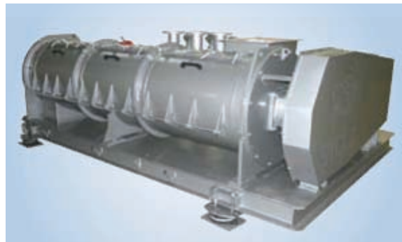
Melazador de acero inoxidable