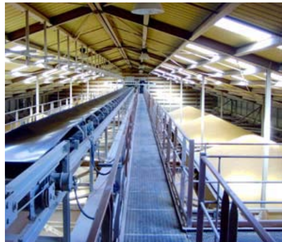
Alimentación de celdas