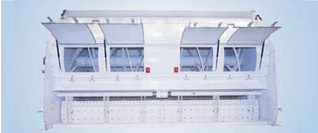
Mezcladora de hélice y fondo de apertura integral

Las soluciones de mezcla propuestas por STOLZ cubren una amplia gama de necesidades.