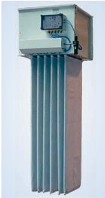
Filtro de bolsas encastrable