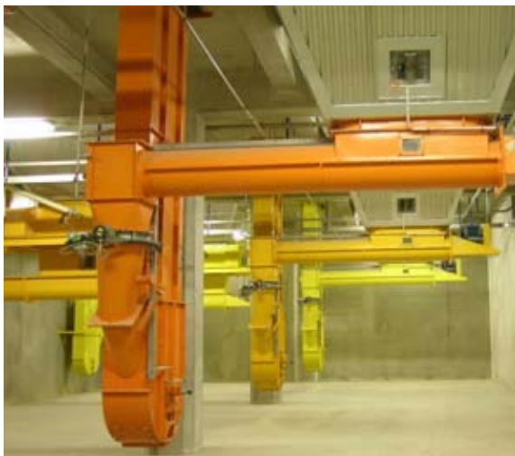
Elevador de cangilones suspendida con vaciado integral