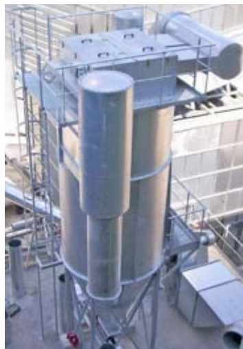
Ciclofiltro con mangas galvanizadas