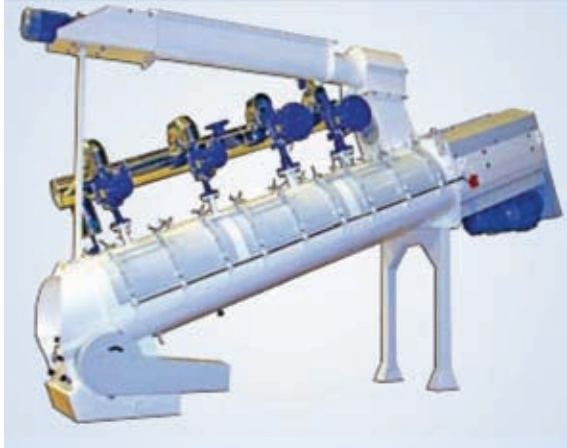
Acondicionador térmico con inyección de vapor

Nuestra línea de tratamiento térmico incluye principalmente 2 máquinas :