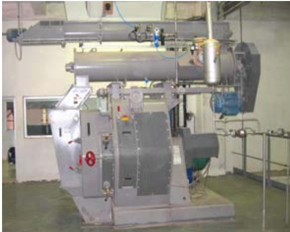
Prensa LYDER y con preparador

Las prensas granuladoras concebidas por STOLZ son óptimas especialmente para la nutrición animal y la acuicultura. Con su alta capacidad y su bajo coste de mantenimiento, estas prensas tienen una buena relación calidad-precio. Su fiabilidad y robustez son un aval de seguridad para su proceso.